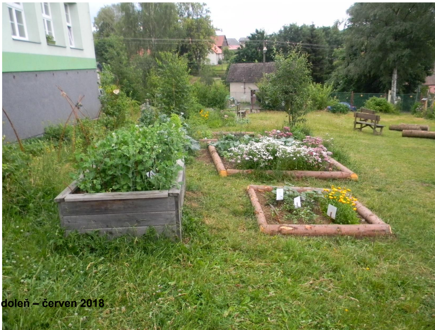
ZŠ a MŠ Oudoleň – červen 2018