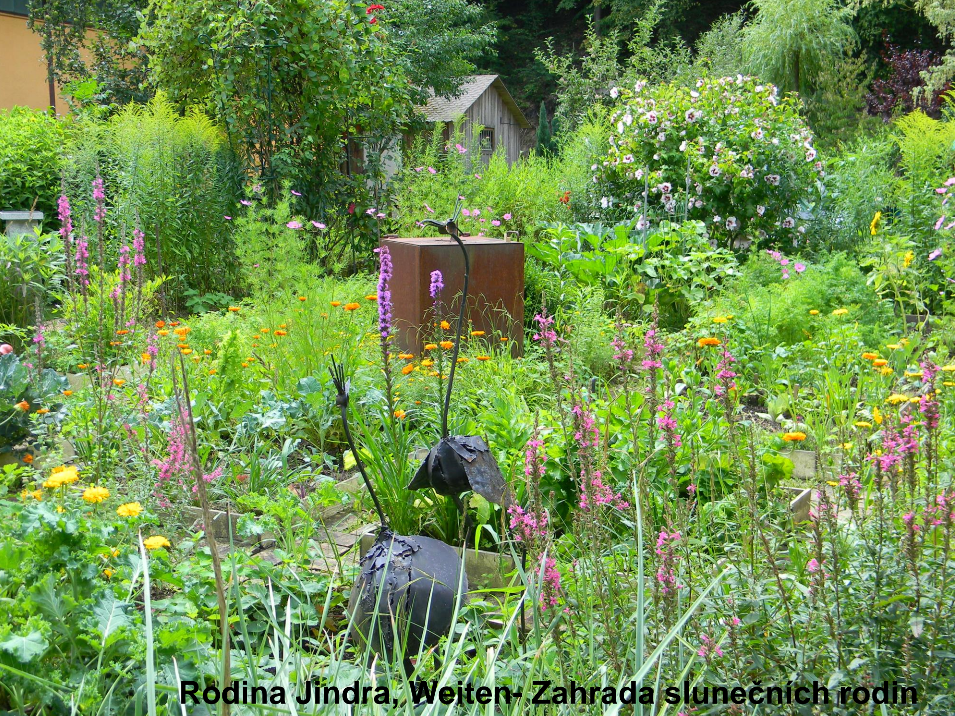
Ródina Jindra, Weiten- Zahrada slunečních rodin