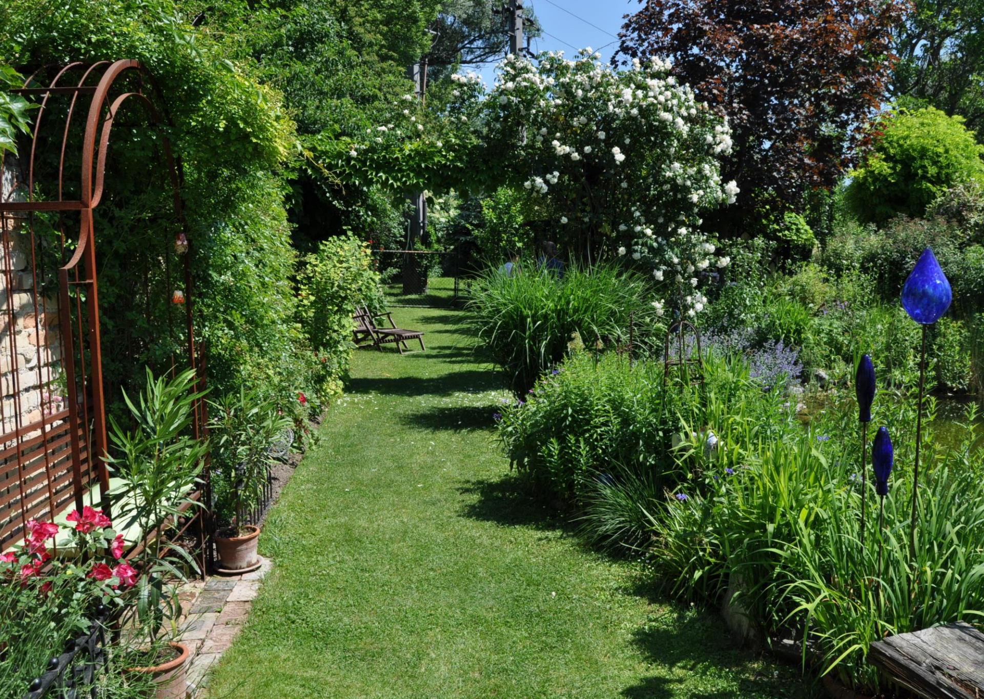
Schaugarten rodiny, Pozzobon, Schwechat-Rannersdorf