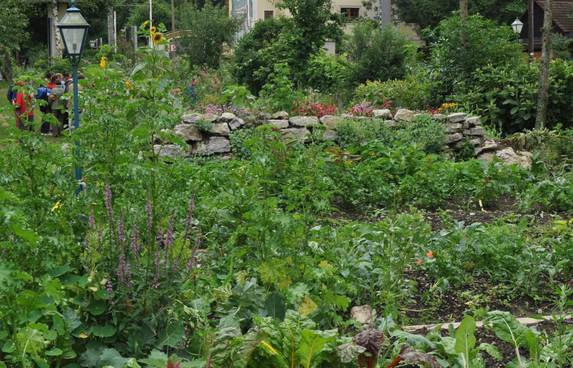
Naturhotel, Rabenstein – zahrada pro kuchyni a pro hosty