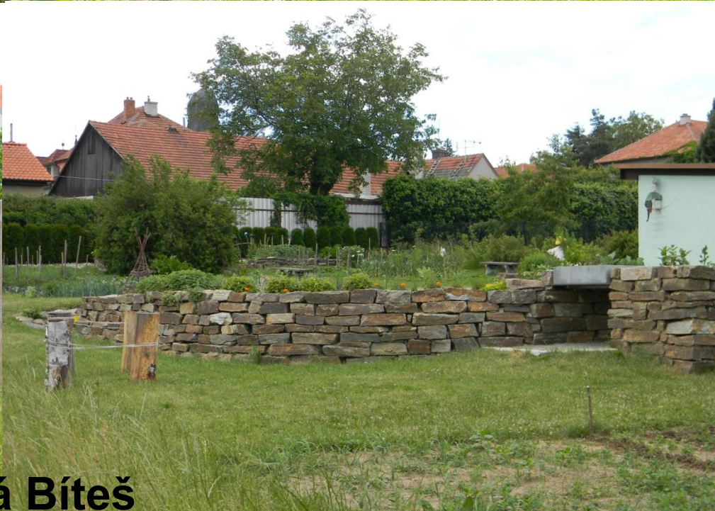
UPZ - ZŠ Tišnovská, Velká Bíteš