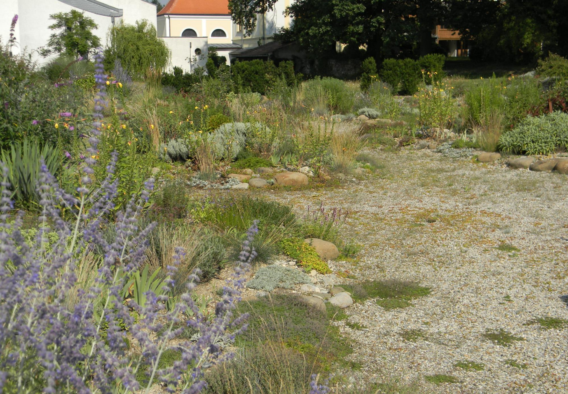
Farní zahrada Hellerhof, Paudorf – původně asfaltové hřiště