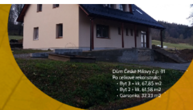
Dům Cedař Milosy 4 p. 31 Po celkové rekonstrukci: • Byt 3 + k: 67,65 m 2 • Byt 2 + k: 61,56 m 2 • Garsonka: 37,23 m 2

Evropská unie Evropský sociální fond Operační program Zaměstnanost