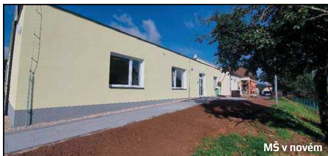
MŠ v novém

Celá stavba byla zahájena v měsíci červnu letošního roku. Do 22. 6. probíhaly práce venku. 20. 6. jsme školku za pomoci místních občanů (chlapi – VELKÉ DÍKY!) vystěhovali a 22. 6. se začalo bourat. Společnost Dolnokralovická stavební, s.r.o. odvedla velmi kvalitní práci. A hlavně – také velmi rychlou. Za necelé 3 měsíce byly kompletně zrekonstruovány veškeré prostory mateřinky včetně školní jídelny s tím, že byla provedena i nová přístavba. Termín stavby byl nastaven velmi přísně z důvodu nutnosti zachování provozu naší školky v červnu a zároveň z důvodu potřeby od začátku září zahájit nový školní rok. Pravda trochu jsme trnuli, jestli se to dá zvládnout, neboť není mnoho zděných domů postavených za necelé tři měsíce. Za pomoci řemeslníků, vedení stavby, stavebního dozoru a projektantů, úředníků, personálu naší školy a školky, občanů a všech ostatních se to však podařilo. Před kolaudací navštívili stavbu postupně zástupci hygieny, hasičů a odboru životního prostředí. Jejich vyjádření se stala podkladem pro vydání kolaudačního rozhodnutí. Stavbu jsme od firmy převzali v pátek 28. 8. 2020, ještě téhož dne byla stavba zkolaudována. A jelikož jsme kolaudaci obdrželi v dopoledních hodinách, byl ještě čas vyrazit na Krajský úřad za účelem navýšení kapacity školky ve školském rejstříku.